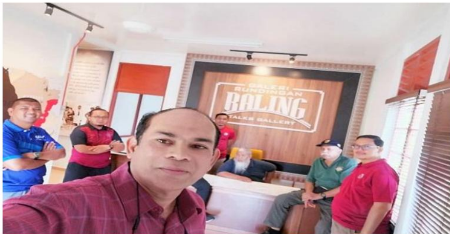
Rajah 4. Galeri rundingan Baling.