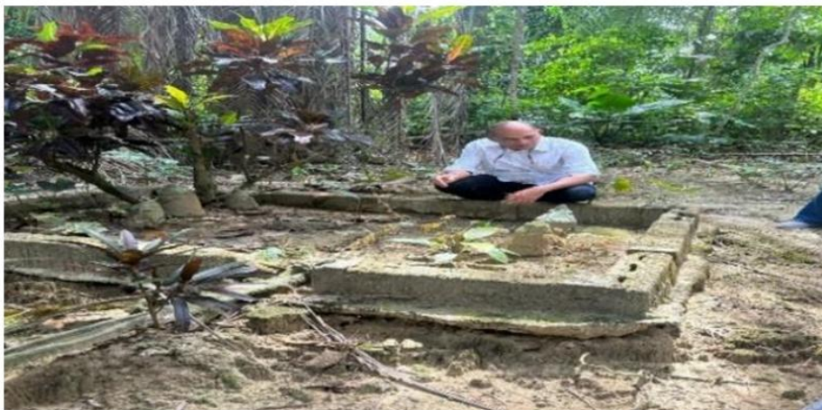
Rajah 1. Pejuang Syahid Peristiwa Bekor.

Rasa benci dan api perkauman ketika penjajahan diterjemahkan dalam bentuk prasangka dan pergeseran kaum antara etnik Melayu-Cina. Konflik perkauman meletus di Johor antara Mac hingga Ogos 1945. Ini diikuti pula dengan pergaduhan di Ayer Hitam pada 20 Jun 1945 dan di Parit Kuman, Mukim Sungai Balang, Johor. Selain kejadian yang berlaku di Johor, konflik Melayu-Cina yang dianggap serius berlaku di Sungai Manik, Perak dan Kampung Bekor, Perak pada 6 Mac 1946. Walau bagaimanapun, usaha segera dilaksanakan dengan pembentukan Pentadbiran Tentera British (PTB). Tumpuan utama diberikan bagi membina kembali pemerintahan di Tanah Melayu dan mengembalikan keharmonian kaum ( Rajah 1 ).