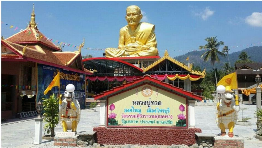
Rajah 5. Wat Thammasirivararam (Wat Kura)-Kampung Kura.