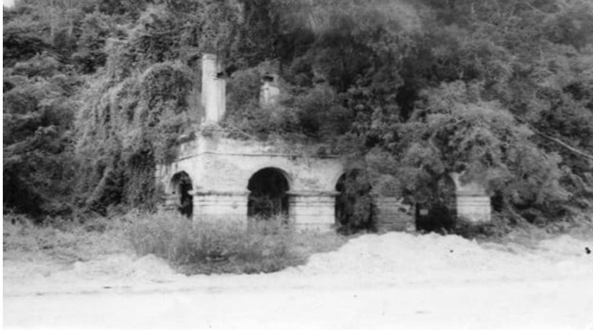
Rajah 4. Kota Aur yang terletak di Gubir Kedah dipercayai milik Raja Bersiong. Kota aur yang terletak di Gubir Kedah dipercayai milik Raja Bersiong.