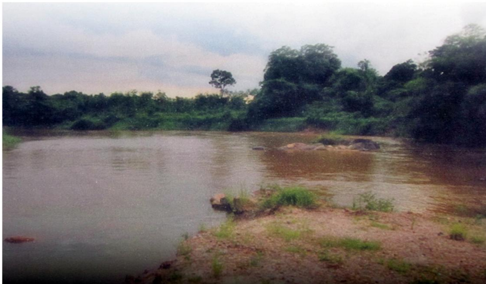
Rajah 7. Pertemuan Dua Batang Sungai.