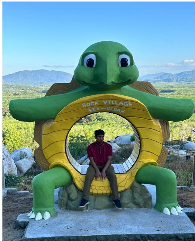
Rajah 6. Replika Kura-kura di Rock Village.