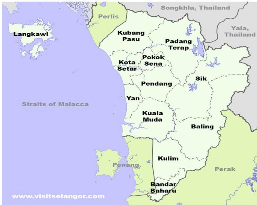
Rajah 1. Kedudukan Peta Daerah-Daerah di Negeri Kedah.