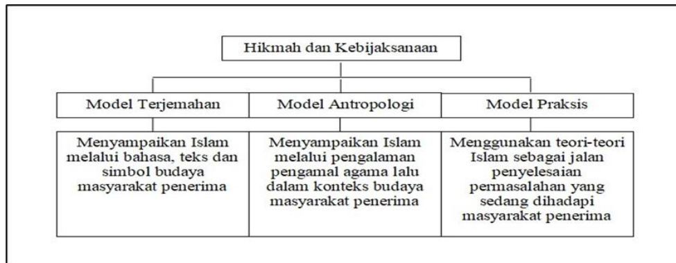
Rajah 1. Dakwah dan model kontekstualisasi teologi.

dengan cara yang baik'. Berdasarkan ayat tersebut, intipati dakwah ada tiga perkara. Pertama, mengajak manusia kepada Islam dengan hikmah dan kebijaksanaan. Kedua, dengan pelajaran yang baik (nasihat-nasihat yang baik). Ketiga, bantah dengan cara baik (berdebat, berdialog dan berbahas dengan lemah lembut). Berdasarkan ayat tersebut ia dapat dikaitkan dengan model kontekstualisasi teologi secara umum, sebagaimana berikut dalam Rajah 1.